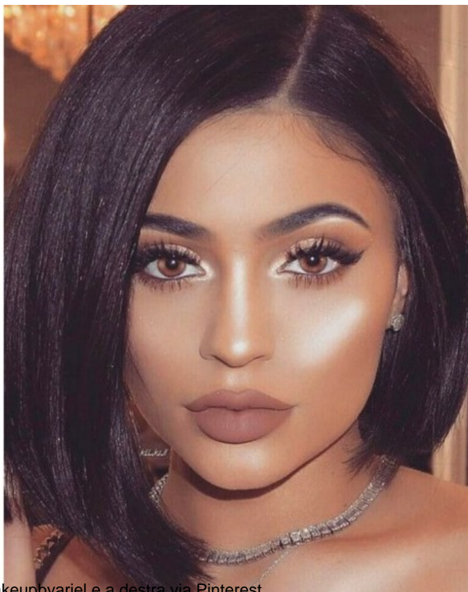
Una delle regine degli illuminanti: Kylie Jenner, e