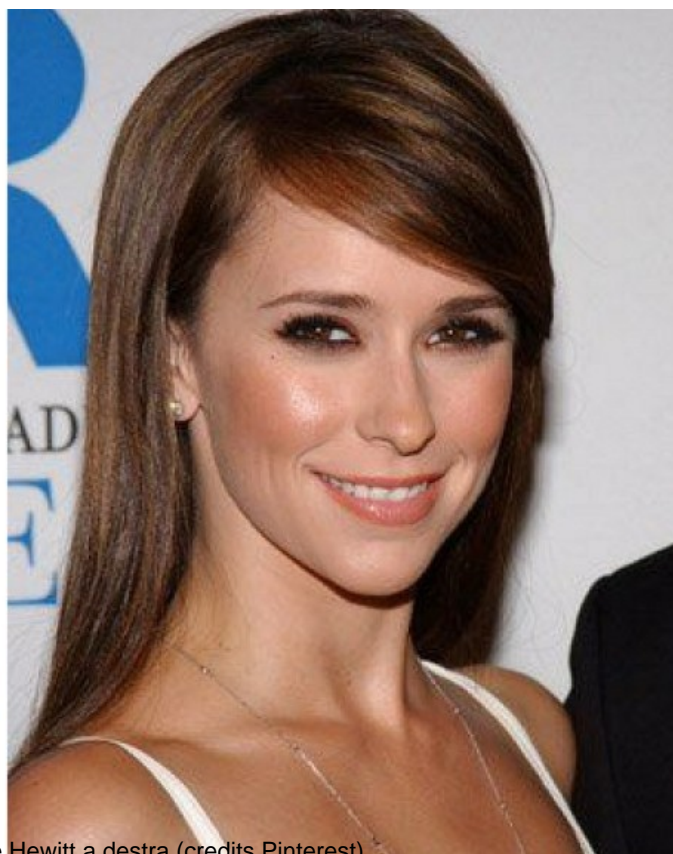
Un effetto naturale su Emilia Clarke a sinistra e su Jennifer Love Hewitt a destra

Sleek MakeUP Highlighting Palette in Cleopatra's Kiss che contiene ben quattro illuminanti: due polveri baked e due in crema. Intensamente pigmentati, ogni formula è facile da sfumare e dona una lucentezza sorprendente che cattura la luce per aggiungere tridimensionalità al tuo trucco estate 2018. €11,95 su lookfantastic.it