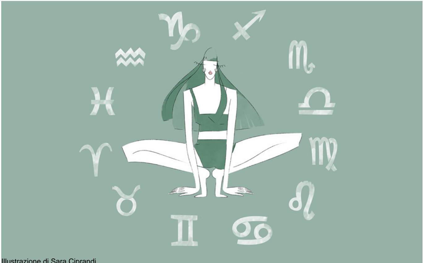
Illustrazione di Sara Ciprandi

Care imbellite nate sotto il segno del Leone, questo mese iniziamo da voi, con il profilo realizzato dall'astrologa Patrizia Balbo .