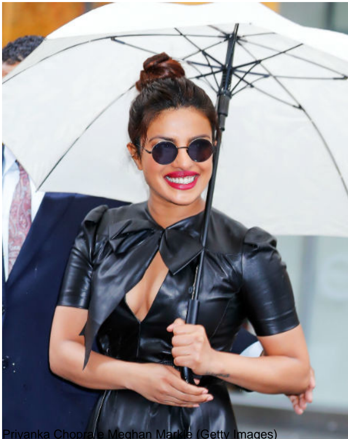
Priyanka Chopra e Meghan Markle

lo chignon come la coda e la treccia tiene a posto le ciocche diventando un'ottima soluzione anti-pioggia. Per i ballerina bun più tirati , meglio proteggere i capelli con uno spray anti-umidità prima di raccogliarli, mentre nel messy bun le imperfezioni create dalla pioggia non faranno che aiutare l'effetto messy.