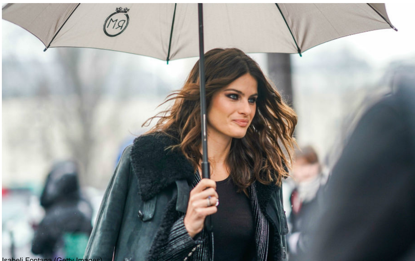
Isabeli Fontana

3. LO STYLING A ONDE MESSY Pioggia e umidità rendono i capelli più voluminosi? Sfruttate l'effetto per creare un'acconciatura ondulata e scompigliata texturizzando le lunghezze con uno spray salino e, se serve, modellando le ciocche con un tocco di gel con le dita. Infine, il risultato finale va protetto con uno spray anti-frizz: ne avrà bisogno soprattutto chi ha i capelli lisci, più esposti all'effetto crespo della pioggia.