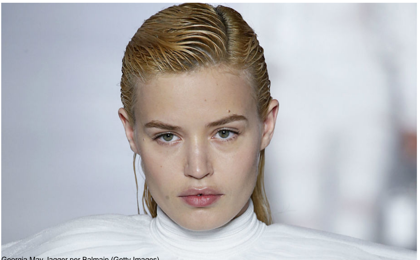
Georgia May Jagger per Balmain

5. L'EFFETTO BAGNATO Il look più astuto in assoluto che risolve ogni timore però è l' hairstyle a effetto bagnato , sempre più amato dalle star sui red carpet, che sotto la pioggia non diventa più un "effetto" ma apparirà più onesto e realistico che mai. Come farlo? Basta un buon gel wet effect e qualsiasi acconciatura può diventare un wet look.